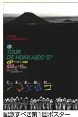
記念すべき第1回ポスター

※1stステージ、2ndステージ、3rdステージは観戦ツアーの対象になっておりません。